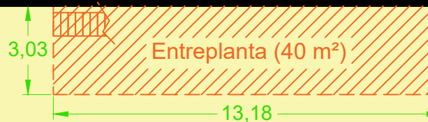
Entreplanta (40 m 2 )